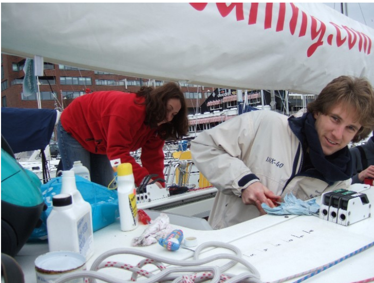
Alles wordt weer zout en zandvrij gemaakt.