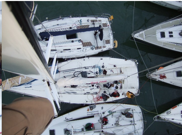
Vanuit de 19meter hoge mast is het schip ver beneden je.