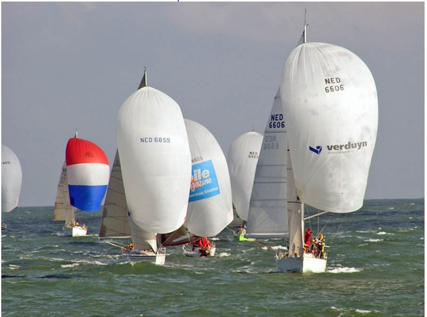
IJspiegel Trophy 2005 - 2006