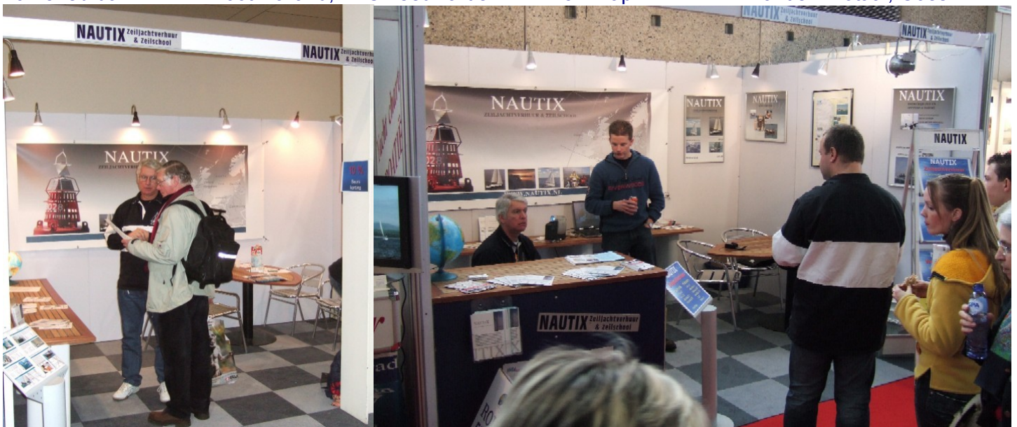
VakantieBeurs, januari in Utrecht

10-15 januari Vakantiebeurs, Jaarbeurs Utrecht 28 februari- 5 maart Hiswa, RAI Amsterdam 10-15 februari Boot Holland, FEC Leeuwarden 15-17 april Maritiem Totaal, Goes