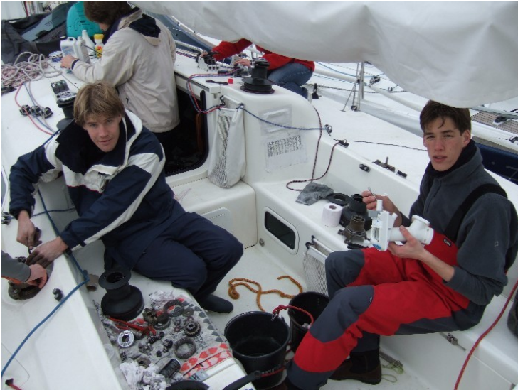
Menig schroefje is hierbij van zijn plaats geweest.